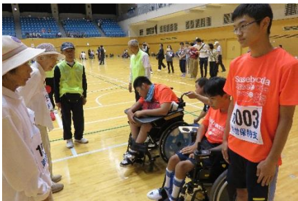
対戦チームと挨拶をしてゲーム開始!

開会式が終わると敷地内にある諫早市中央体育館に移動して、試合の準備を行いました。ボッチャ競技は全43チームを8パートに分け、予選リーグを行い上位1チームが決勝トーナメントに進めるという日程で行われました。当日は予選リーグで2試合行い、一勝一敗で決勝トーナメントに進むことはできませんでしたが、公式戦初勝利を納めることができ、ボッチャ愛好会にとって大きな一歩となる大会になりました。たくさんの応援有難うございました!