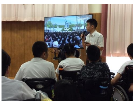
平和記念式典の様子を テレビ中継で見ました。