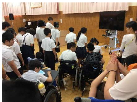
原子爆弾が投下された11時02分 生徒全員で黙祷しました。