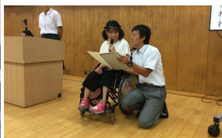
生徒会副会長として、全校集会 で、平和宣言をする生徒