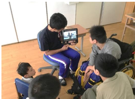
自分達の登校時の様子を確認しました。

動画では、自然に挨拶をしている生徒や恥ずかしがって挨拶ができていない生徒もいたが、「自分の姿」を客観的に振り返り学習をしたり、友達の「良い手本」を見たりすることは大きな刺激となったようだ。どの生徒も挨拶名人を目指そう。