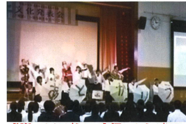
感謝のありがとう 痛恨のあとがけ