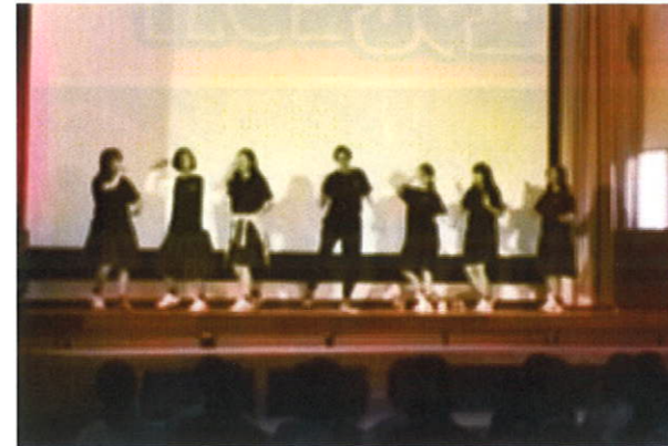
イングリッシュクラブ 国際色豊かに躍動