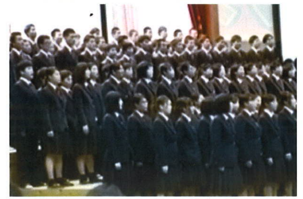
重厚なハーモニー 3年生全員合唱