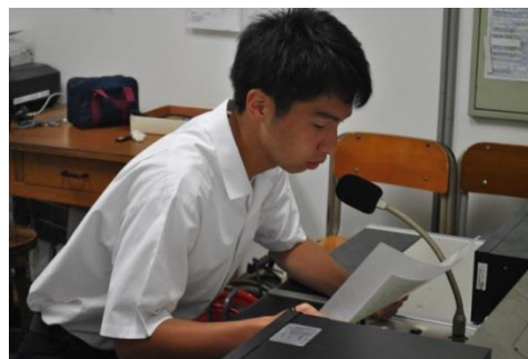
2年生代表生徒の決意表明