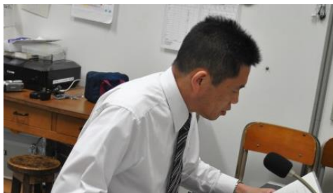
校長先生からの激励の言葉

部活動を引退する3年生から下級生に対して、メッセージが伝えられました。感染症対策のため、体育館での集合を避け、放送で実施しました。