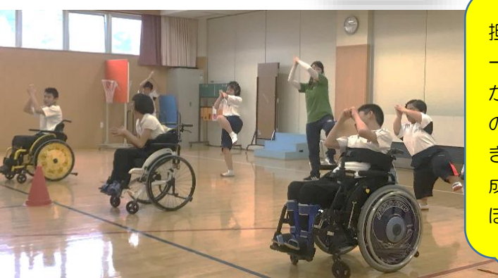
「パプリカ」の曲に合わせて、わかくす体操をする生徒。コミカルで楽しい体操だ。

担当者：仲間と一緒に身体を動かしながら体育の楽しさや「できた」という達成感を味わってほしいです。