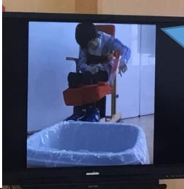
離れた場所からごみ箱にマジックを投げ入れました。