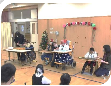
4組 「歓びの歌」「赤鼻のトナカイ」を演奏