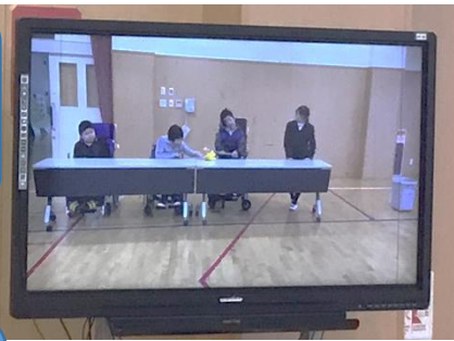
2組、3組「すご技動画」動画を編集してびっくりテクニックを披露。