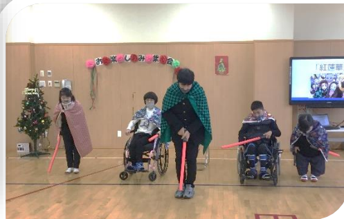
1組「歌とダンス」今年のヒット曲「香水」と「紅蓮華」に合わせてダンスを披露