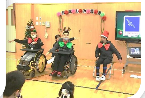
5組「クイズ わかくす3人の壁」2学期の学習をクイズとして出題