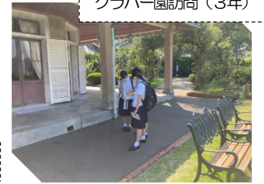
グラバー園訪問(3年)