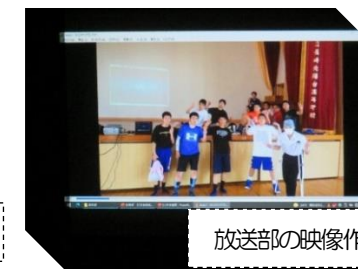
放送部の映像作品