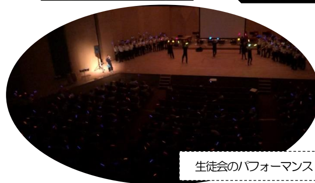
生徒会のパフォーマンス