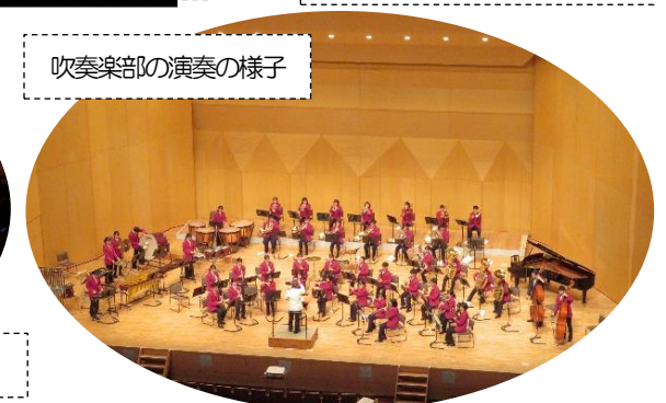
吹奏楽部の演奏の様子