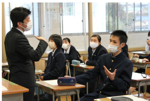
初めての老岐高寺子屋の様子

保護者の皆様、お忙しい中10日(金)の学年PTAにお越しいただき、ありがとうございました。76回生の修学旅行は広島・島根方面に決定いたしました。素晴らしい研修となりますように、事前準備を進めてまいります。