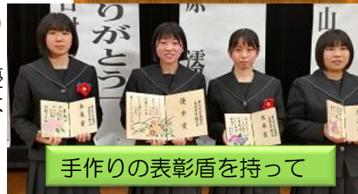
手作りの表彰盾を持って