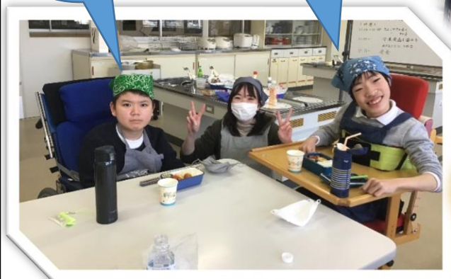
おいしそうでしょ！