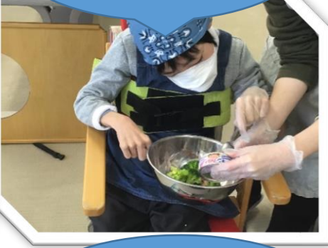
ブロッコリーにツナ、マヨネーズ、お酢を入れて混ぜる！混ぜる！