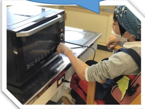
冷凍のブロッコリーを解凍だ。