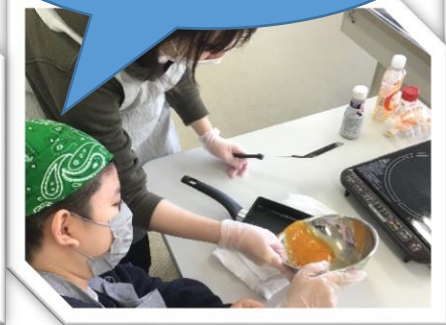
卵に、塩、砂糖、醤油も少々入れて混ぜ、フライパンにゴー！