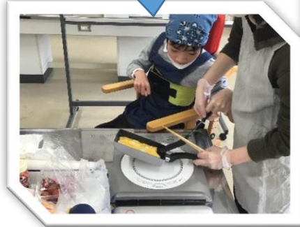
卵を巻くのが難しい！