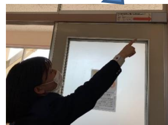
各教室に貼っています！