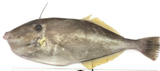
ナガサキイッカクハギ (ウスバハギ)

温暖な海域に生息するナガサキイッカクハギ(ウスバハギ)は、長崎県水産試験場で陸上かけ流し養殖での中間育成に成功し、成長も早く、次世代の長崎県ブランド魚として売り出せるか、期待がかけられています。本校の開発チームは、味付けに和食・中華・洋食の要素を取り合わせ、長崎らしい缶詰を開発しました。