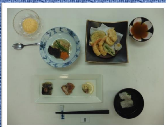
食物1級検定 (65歳祖父の誕生日)