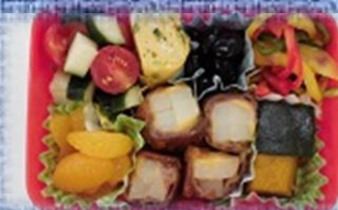
食物2級検定 (17歳男子の弁当)