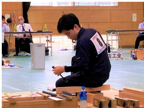
ものづくりコンテスト

機械系、電気系、建築系の専門科目を学ぶことができ、将来の職業選択の可能性が広がります。各種技能競技大会や、様々な資格試験に挑戦できます。