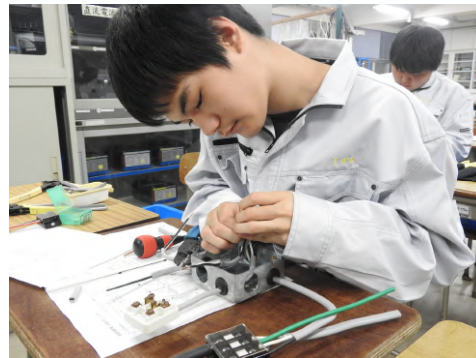
第一種電気工事士