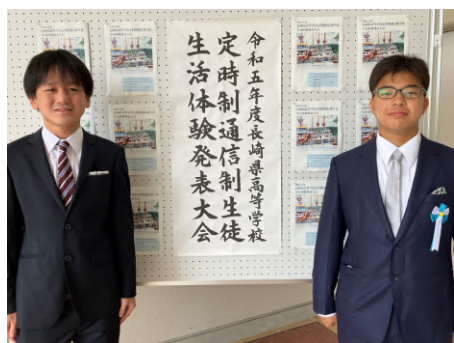
長崎県生活体験発表大会

生徒交流会、校内生活体験発表会、校内競技大会、体育祭、文化鑑賞会、修学旅行、送別ボウリング大会など、楽しい学校行事で交流が深まります。