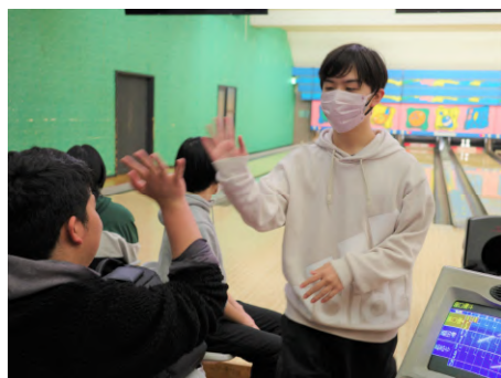
送別ボウリング大会