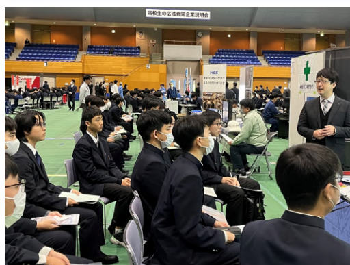
広域合同企業説明会

希望の進路実現に向けて手厚くサポートします。本校では昼間の時間帯にアルバイトの就労を推奨しています。身に付けた専門技術とアルバイトの経験が希望の進路実現につながります。