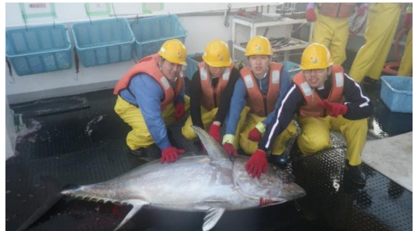
100kg超のメバチマグロ