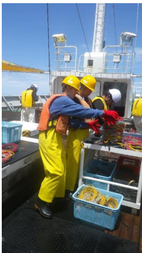
立ちっぱなしで行う揚縄作業(夜まで続く)