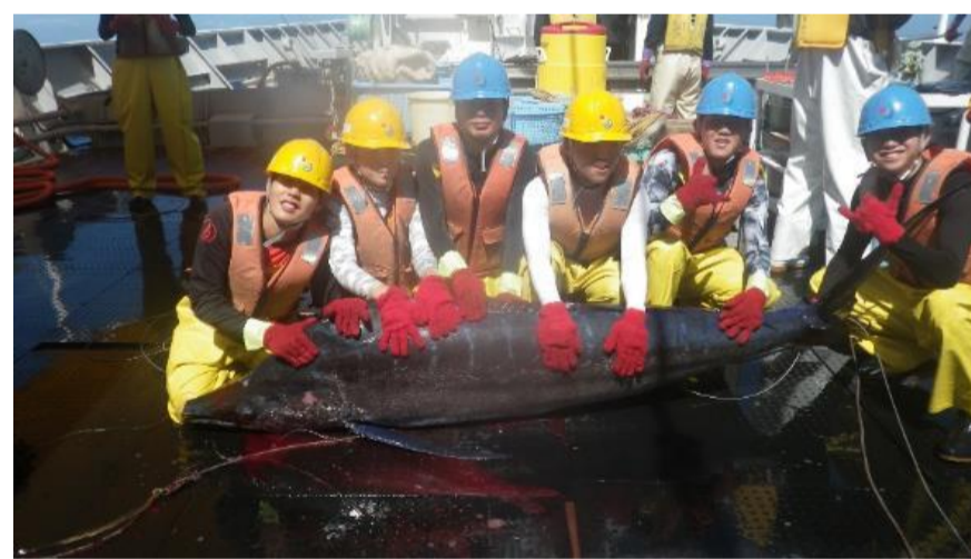
角を切られた100kgのクロカジキ