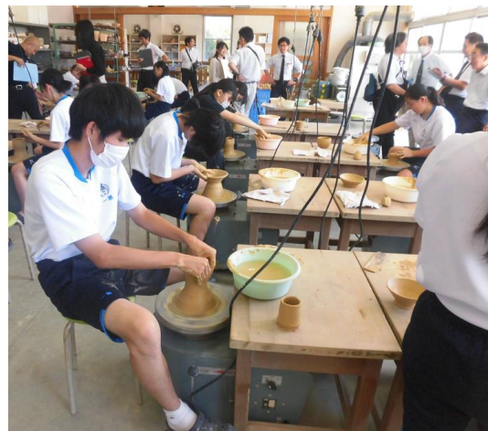
9月26日、高教研美術部会研究大会での1年4組 陶芸の授業の様子