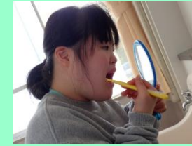
ブラッシング指導

更衣等の身辺処理や食事マナー、歯磨き、自分の役割など、毎日繰り返して学習することで日常生活に必要な力を高めています。