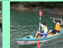
校外学習 「宿泊体験学習」