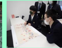
校外学習 「歴史研究センター」