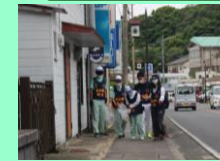
総合的な探究の時間 「地域清掃」