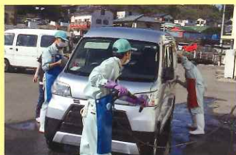
JA 本店での公用車の洗車