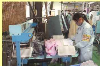
クリーニング店での実習