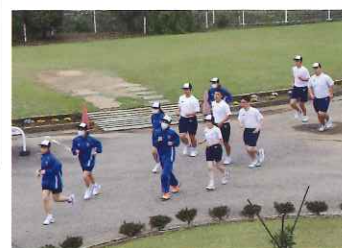
体力 トレーニング