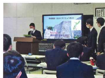
総合的な 探究の時間 (KIBOU タイム)