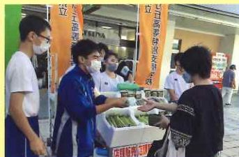
A コープ西諫早店での店頭販売