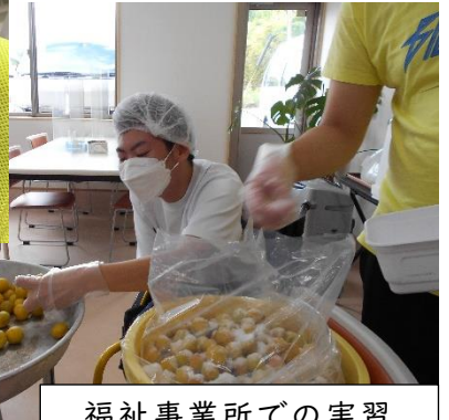
福祉事業所での実習 【Ⅲ課程】