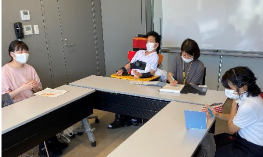
長崎県立大での授業体験 【Ⅰ・Ⅱ課程】