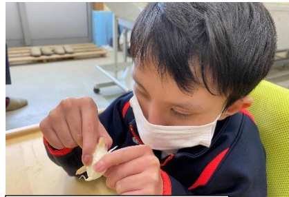
福祉事業所での実習 【Ⅳ課程】