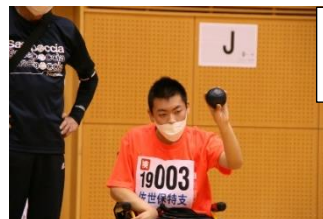
障害者スポーツ大会 (ボッチャ競技)