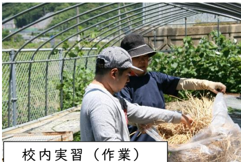
校内実習（作業） 【Ⅳ課程】