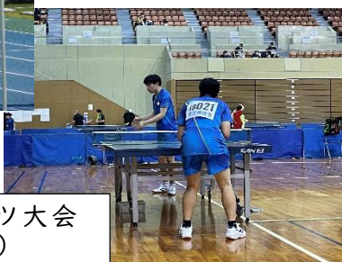
障害者スポーツ大会 (卓球部)