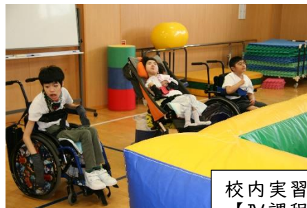
校内実習（レクリエーション） 【Ⅳ課程】