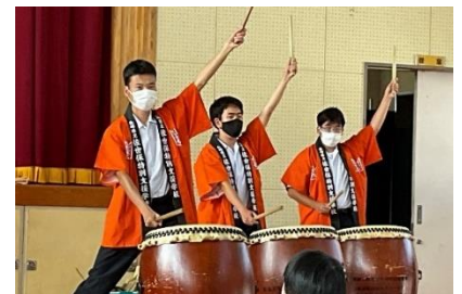
高総体壮行会での演奏 (和太鼓部)