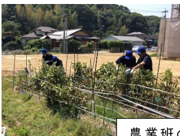
農業班の学習の様子