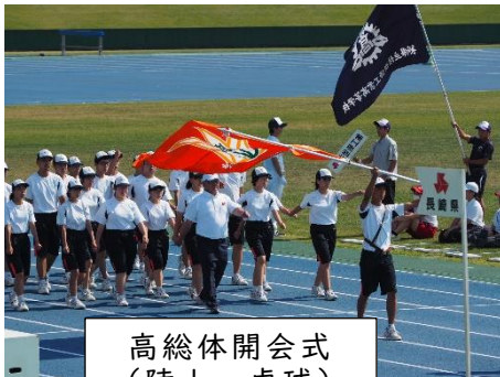
高総体開会式 (陸上・卓球)