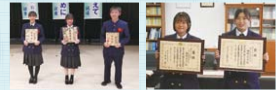
最優秀賞・優秀賞