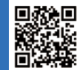
中五島高校ホームページ 随時更新中!!

〒853-2303 長崎県南松浦郡新上五島町宿ノ浦郷162-1 TEL(0959)44-0265 FAX(0959)44-0440 ホームページ https://www2.news.ed.jp/section/nakagoto-h/