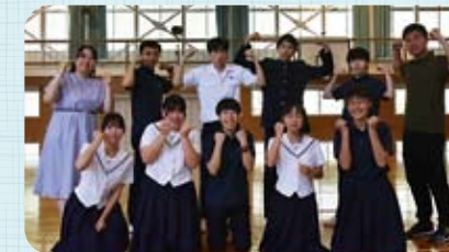
楽らくスポーツ部