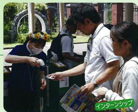
インターンシップ