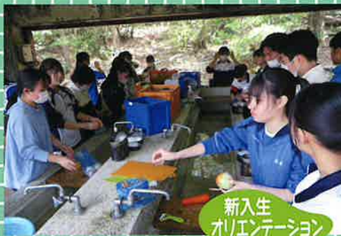
新入生 オリエンテーション