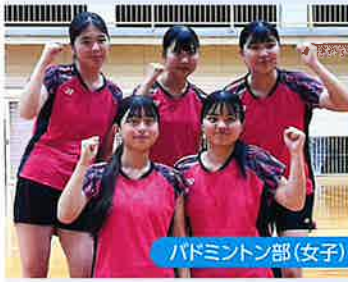
バドミントン部(女子)