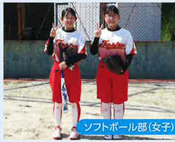
ソフトボール部(女子)