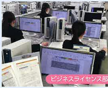
ビジネスライセンス部