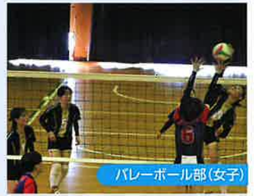
バレーボール部(女子)