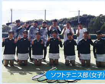
ソフトテニス部(女子)