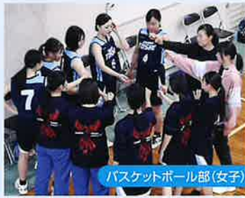
バスケットボール部(女子)