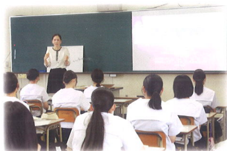
大学セミナー(2年生)