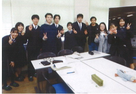
留学生との交流研修