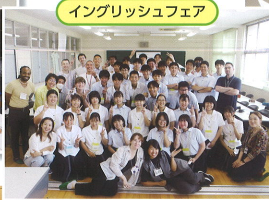
イングリッシュフェア