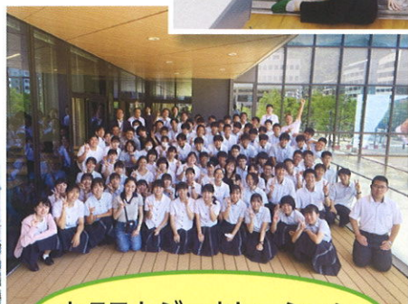
ネクストジェネレーションミーティング