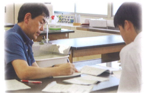
質問して理解する…