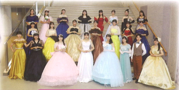
ファッションショー(3年)