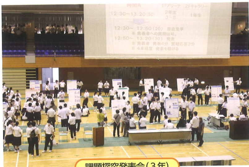
課題探究発表会(3年)