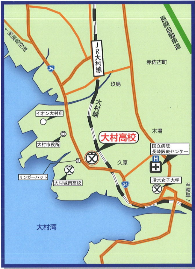
県営バス「大村公園」下車すぐ