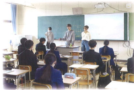
卒業生を招いての懇談(土曜講座)