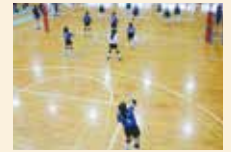
バレーボール女子