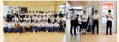
オーケストラ・コーラス