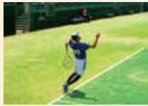
ソフトテニス男子