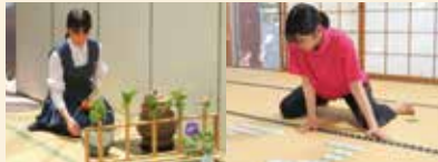
茶道・競技かるた