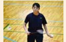
バドミントン女子