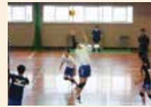
バレーボール男子