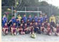
ハンドボール男子