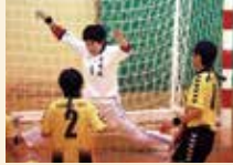
ハンドボール女子