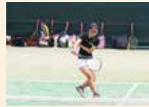
ソフトテニス女子