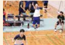
バドミントン男子