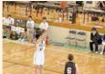
バスケットボール女子