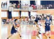
バスケットボール男子